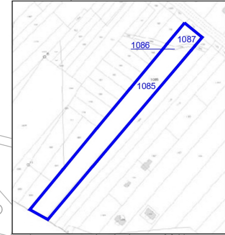
STRALCIO CATASTALE FG 31 PART.LLE 1085,1086, 1087, 1:2000

- COMUNE DI TREPuzzi - (Provincia di Lecce)